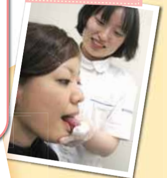
食べ物を使わない訓練

唇や舌の運動、咳払いの練習、口の中を刺激してつばを飲み込む練習など、食べ物を使わずに行う訓練です。基礎的な運動を繰り返し行うことで「食べる」ために必要な機能の改善を目指します。 言語聴覚士：石黒