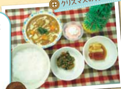
クリスマスの行事食

当院には刻み食に替わる食事として「やわらか食」があります。見た目は普通食に近いですが、舌と上顎で潰せる程度の軟らかさで、容易に飲み込みの出来る安全な食事です。見た目、味共に患者さまから好評です。 管理栄養士：中谷