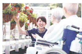
藤田学園 創立50周年記念事業 七栗記念病院 新病院名お披露目式