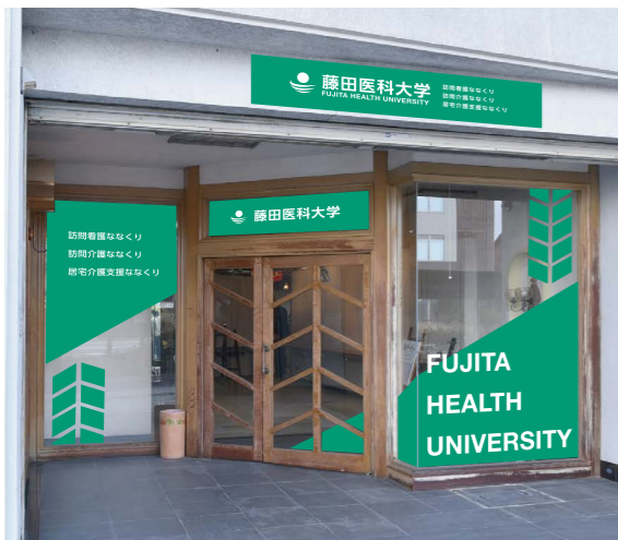
写真は施工イメージです。